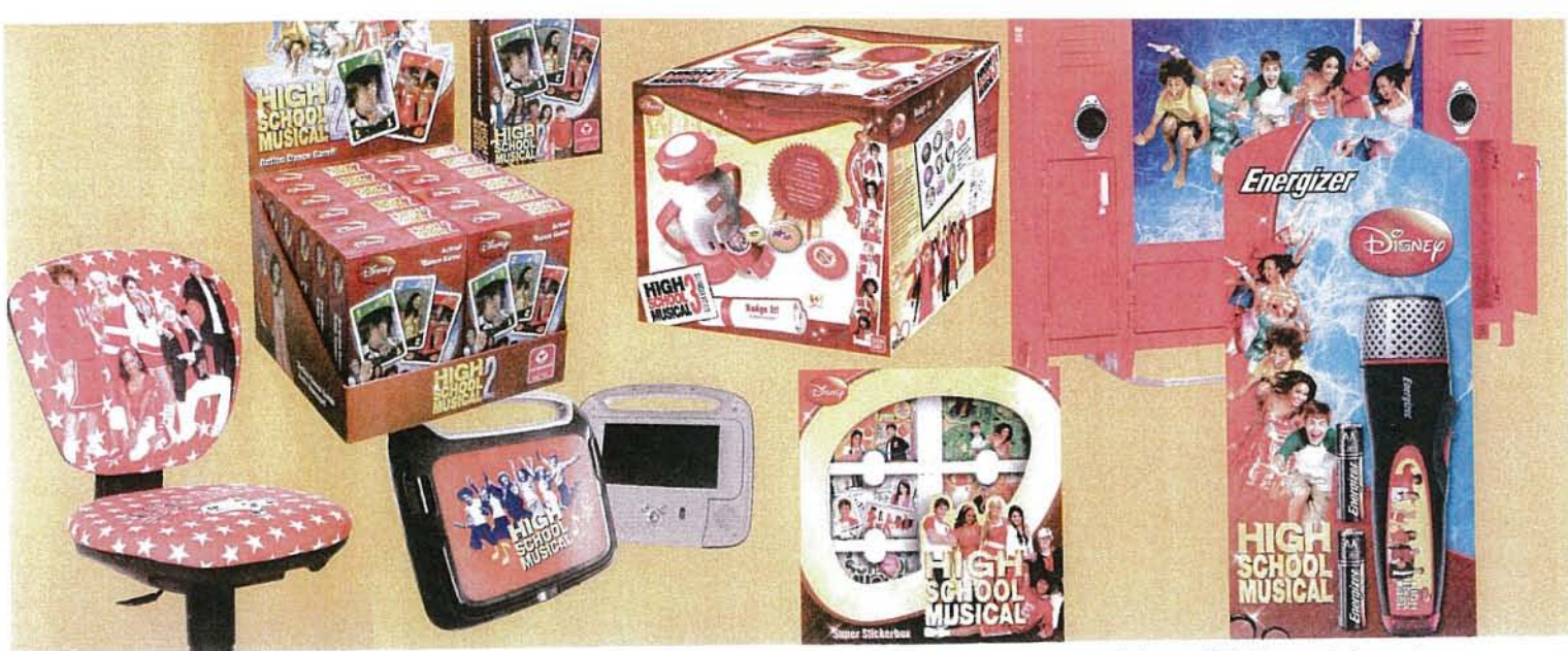
Kreative Umsetzung der Kundenbedürfnisse in Lizenzprodukte: Auf Kleidungsstücke sowie Accessoires folgten Bastel- und Konstruktionsspielzeuge sowie Elektronikartikel.