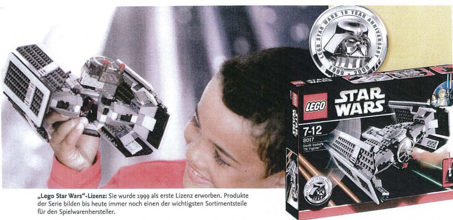
„Lego Star Wars“-Lizenz: Sie wurde 1999 als erste Lizenz erworben. Produkte der Serie bilden bis heute immer noch einen der wichtigsten Sortimentsteile für den Spielwarenhersteller.